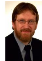
Bernhard C. Witt it.sec GmbH